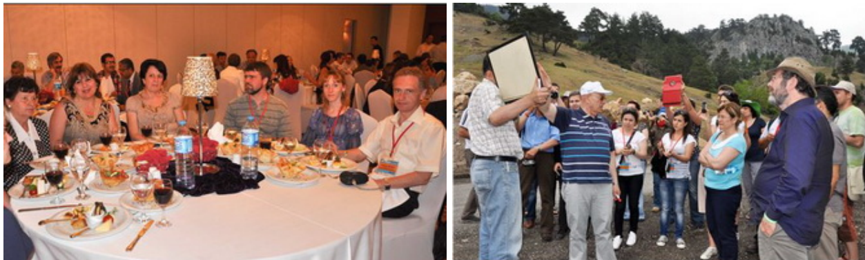
Left, Georgian and Russian delegates joined in the Symposium dinner. Right, Field trip in the Taurus Mountains