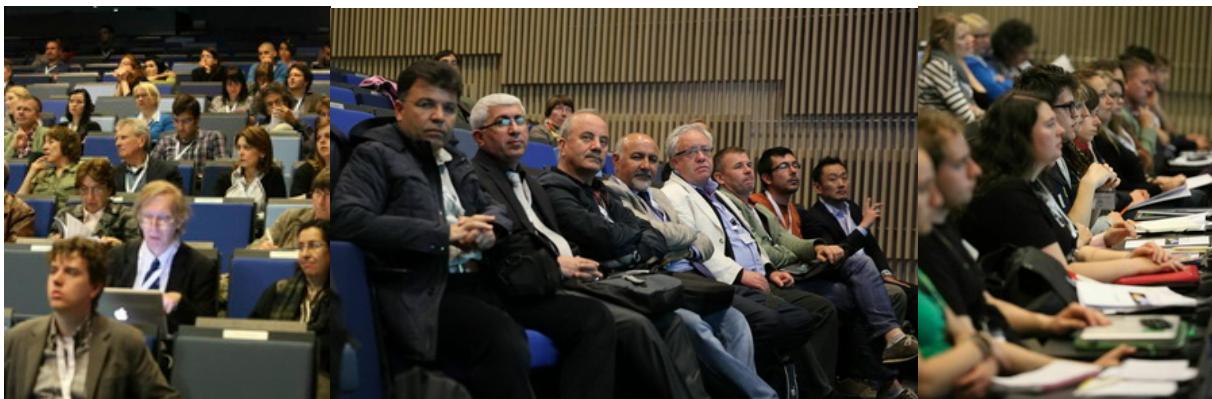
International attendance of teachers and young graduate students

The event was launched at a civic reception hosted by the mayor and held in the magnificent town hall of the city. Delegates also had the opportunity to participate in the ‘Procession of the Holy Blood’, a unique event held each year since 1291 on Ascension Day. The procession represents scenes from the Old and New Testament interpreted by guilds, trades, brotherhoods and chambers of the city. A second part of the procession was devoted to the relic of the blood of Jesus brought to Bruges by Derrick of Alsace, Count of Flanders after the second crusade in 1150.