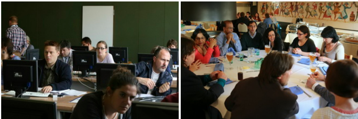
Class room were always very busy time, before the final dinner in an old brewery.

The conference fieldwork visit explored the area that connects Bruges by canal to the North Sea port of Zeebrugge, located about 10 km away. The conference dinner was held in one of the oldest breweries in the city and included a guided tour.