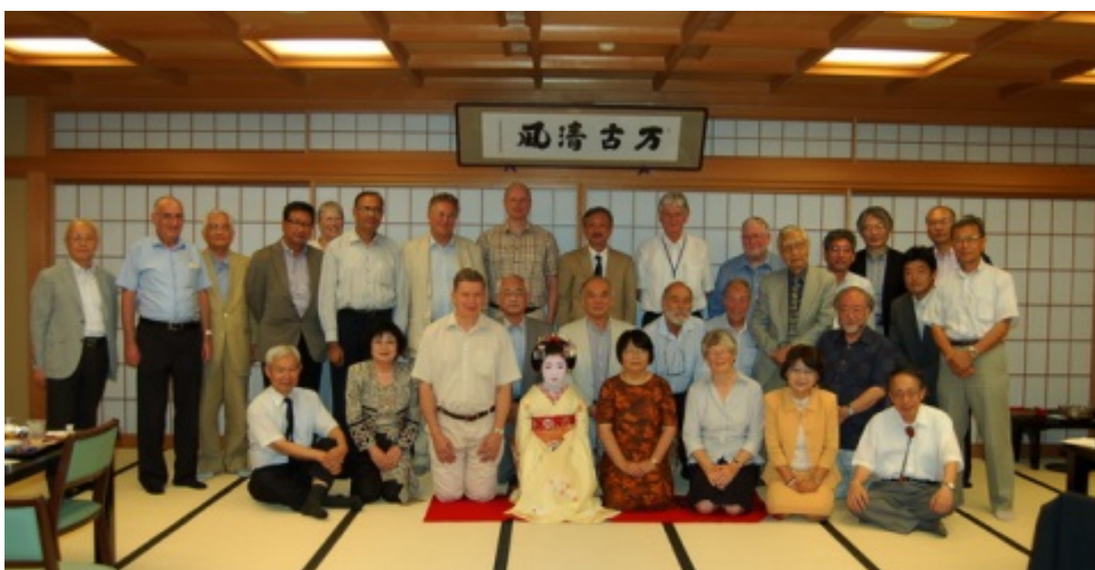
Dinner offered to IGU EC by Dr.Eng. Onishi Takashi, President of the Science Council of Japan

IGU Archives follow-up. Decisions need to be made regarding the manner in which IGU archives are collected (for example, voluntary or compulsory). Further feedback will be available following VP Soyez’ visit to Leipzig.