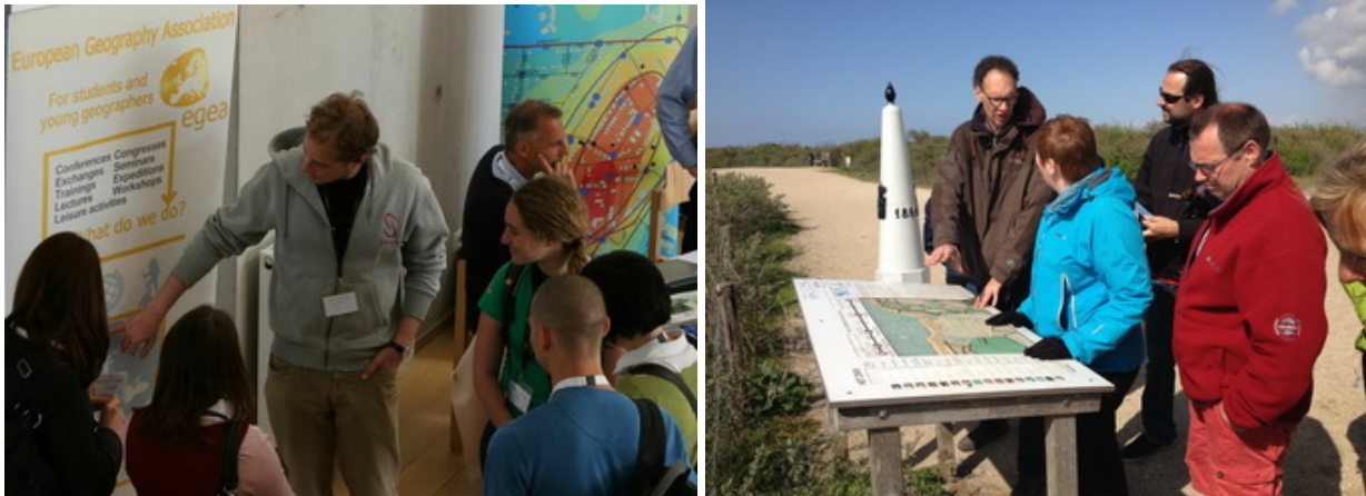
Map observation, in class rooms and in the field

The association held its Annual meeting and elected a new Presidium to stand for 2013-2015. An exhibition was contributed to by a number of publishers companies and NGOs, as well as several national and international societies including the Russian Geographical Association and the European Association of Young Geographers (EGEA). Representatives from more than 10 other geographical associations also participated.