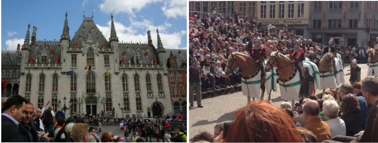
Host of the Conference has been the wonderful medieval Belgian city of Bruges

More than 200 geographers from around the world gathered to explore the role of geography in linking tradition and future. Over 120 presentations were given in the paper sessions that ranged in area from Human, Economic and Cultural Geography to Geographic Information Science, Environmental, Physical and Educational Geography.